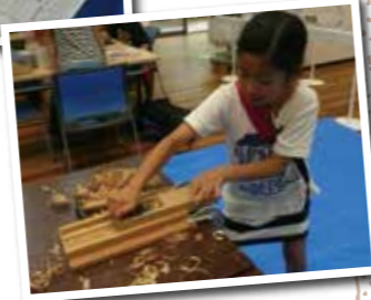
▲端材がマイはしに！