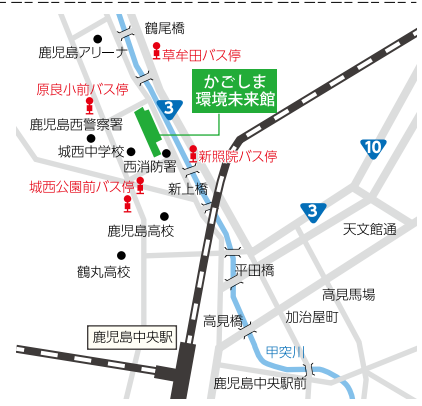
リサイクル適正の表示:紙へのリサイクル可

かごしま環境未来館だよりは、かごしま環境未来館、市役所、各支所などで無料配布しています。