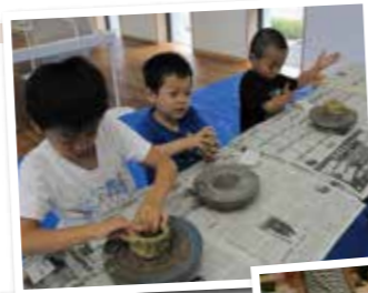
◀リサイクル粘土をこねこね！

12月の地球温暖化防止月間にも企画展を開催する予定ですので、楽しみにしてくださいね。