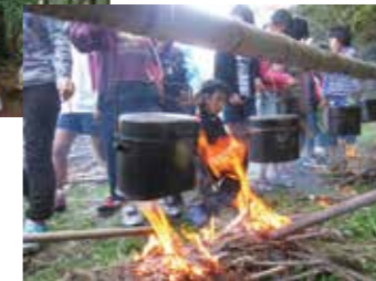
▲たき火で飯ごう炊飯