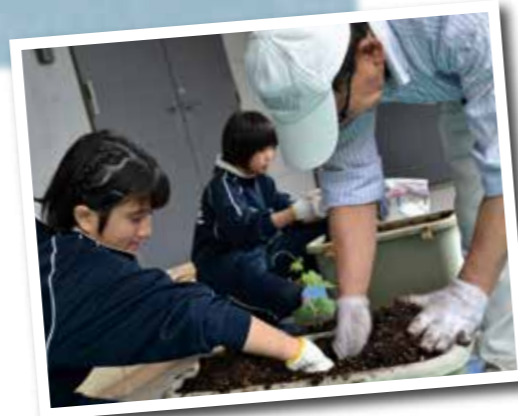
立派に育っています♪

未来館では、サポーター(ボランティア)さんや職場体験の中学生のみなさんが苗の植え付けをしてくれました。植え付けは大変でしたが、順調に育って、夏の日差しを和らげてくれています♪