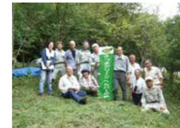
▲メンバーでの交流会は楽しい♪