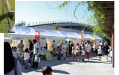
全てのブースを制覇しよう♪