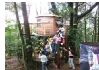
▲がんばり山の自然で遊ぼう♪

住 所: 〒890-0082 鹿児島市紫原3丁目55-21 電話番号: 099-250-4028