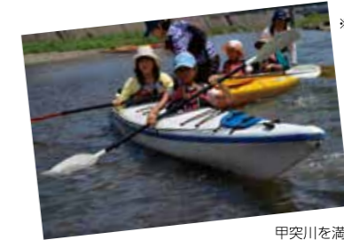
※カヌー体験は事前申込が必要です。

親子で参加できる「カヌー体験」や、人気映画の上映会、昔懐かしの遊び、賞品つきのエコクイズラリーなど、内容盛りだくさんのイベントを開催します。夏休みが終わってしまったけど遊び足りない子どもたち、全員集合！！