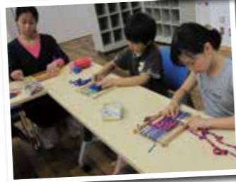
▲古布がかわいいコースターへ変身♪