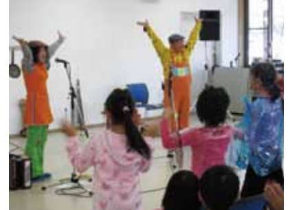
▲昨年度の音楽ステージの様子