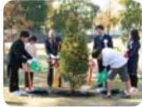
「マーちゃんやさしい環境講座」と植樹