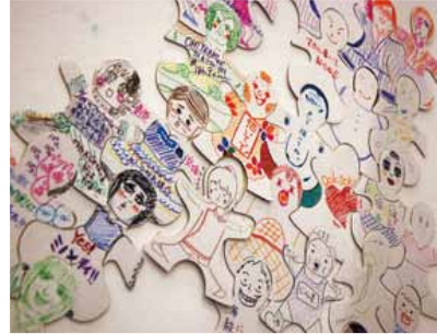
▲人型パズルをどんどんつなげてみよう!