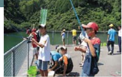
▲外来魚駆除大会の様子