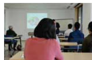
▲みなさん熱心に聞いています