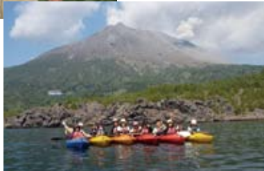
▲錦江湾でシーカヤックツアー