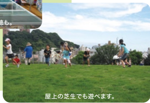
屋上の芝生でも遊べます。

展示だけではなく、 いろいろな活用法がある未来館。 大人も子どもも みんなでゆ〜っくり楽しめます。