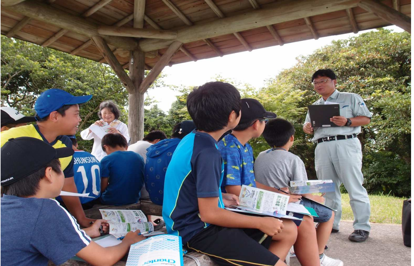
▲風力発電について勉強中