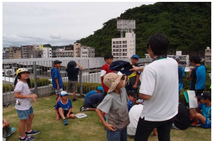
▲未来館にも太陽光発電が！

各地域から子どもたちが集まり、再生可能エネルギー関連施設の見学をしました。牟礼岡ウインドファームでは、高さ60mの風車に圧倒され、写真撮影に夢中になってしまうほどでした。未来館の太陽光パネルの見学では、太陽光の発電量がどれくらいなのか教えて頂きました。九州初の発電所の小山田小水力発電所では、水のちからですごい勢いで回っているタービンの支柱を見ることができました。鹿児島の豊かな自然を使い、エネルギーを作り出す施設がたくさんあることを知り、それぞれの個性が光る自由研究が完成しました！