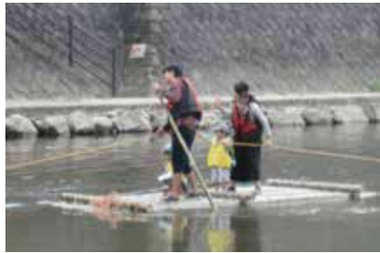
▲竹いかだで水遊び♪