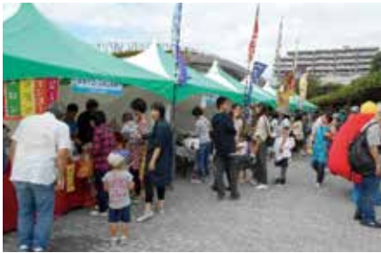
▲飲食ブースも出展♪

「環境フェスタかごしま」は、環境団体や事業者、行政が協働して開催するイベントです。様々な展示やキッズダンスなどのステージショーを楽しみながら、いろんなエコを見つけましょう！竹いかだ体験やエコに関する楽しいワークショップが体験できます。すてきな景品がもらえるクイズラリーも実施！子どもから大人まで楽しめるイベントが盛りだくさん！10月の連休はぜひ未来館へお越しください。