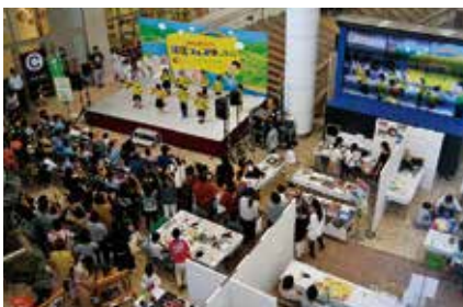
▲ダンスなどステージイベントを予定

環境に関するワークショップ、工作体験、ステージショーなど楽しく参加できるプログラムをご用意して、お待ちしております。