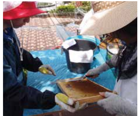
▲みつばちPROJECTではちみつしぼり