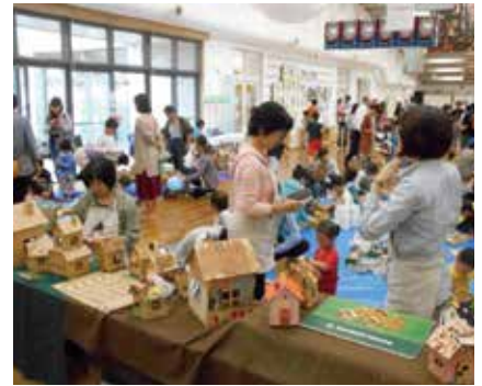
▲多数のワークショップブースが出展♪