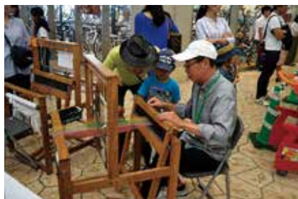
▲楽しいワークショップも盛りだくさん。