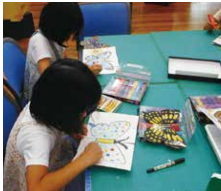
▲ちょうちよのからくり絵を作成中!

12月の地球温暖化防止月間にも企画展を開催する予定です。ぜひ、楽しみにしてくださいね。