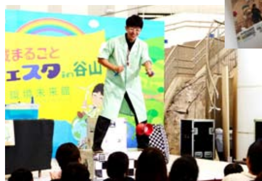
▲らんま先生のeco実験ショー