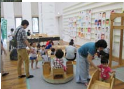
▲「わたし大すき」展と木製遊具