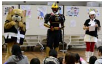
▲薩摩剣士隼人とつつんも来ました!