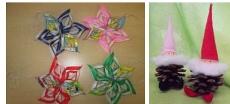
▲折り紙やチラシで作ったクリスマスオーナメント ▲松ぼっくりで作った妖精

今年も地球温暖化防止月間に合わせて、楽しみながら環境を学ぶ企画展を開催。今回のテーマは「ecoLAND ～クールチョイスで冬を楽しもう!～」期間中は、全国各地の美味しい鍋料理の紹介やビニール袋で凧作り、松ぼっくりで妖精作りなどの工作体験、屋内でカーリング体験もできます!その他にも、ハニーホットレモンティーのふるまいや餅つき体験など盛りだくさん!ぜひお越しください。詳しくは環境未来館ホームページに掲載しますのでご覧ください。