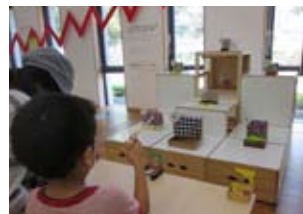
▲輪ゴム鉄砲で得点を競いました。