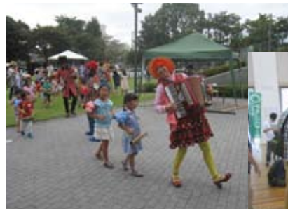
▲PiPiさんとリユース打楽器でパレード