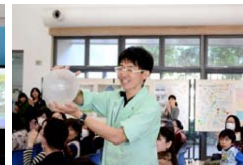
▲らんま先生のエコ実験パフォーマンス!