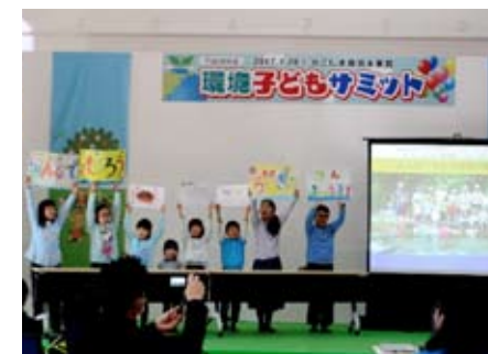
▲子どもたちの声に耳を傾けてみませんか?

これからの世を担う子どもたちが、環境学習を通して学んだ成果を発表する「環境子どもサミット」。今年も5つの子ども達の団体が、大人の皆様へ環境に関するメッセージを伝えます。昨年、会場をおおいに盛り上げてくれたエコ実験パフォーマンスもありました!また、同時に環境フォト&ムービーコンテストの表彰式も行います。子ども達と一緒に環境について考えてみませんか。