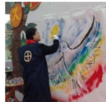
▲ライブペインティングの様子