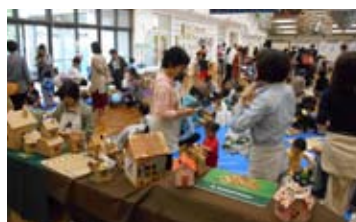
▲たくさんの方でにぎわいました