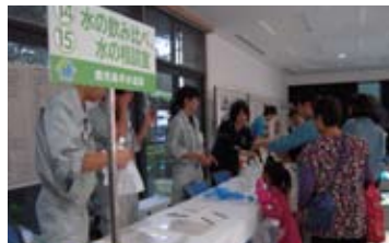
▲水の飲み比べに挑戦