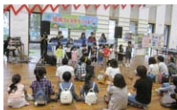
▲一緒にステージで歌いました♪