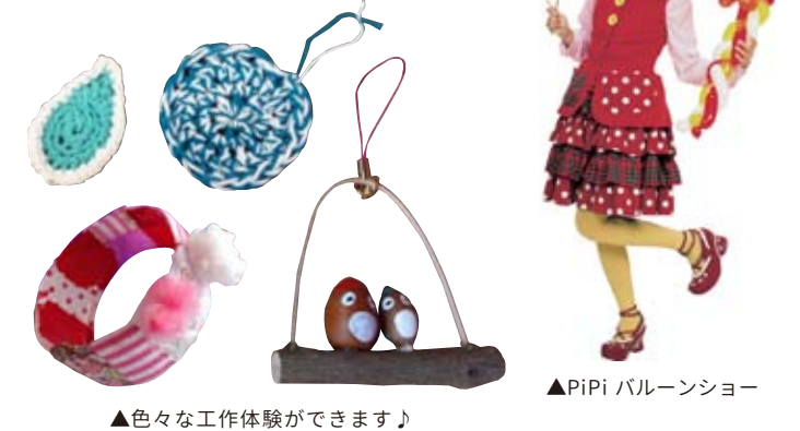
▲色々な工作体験ができます♪