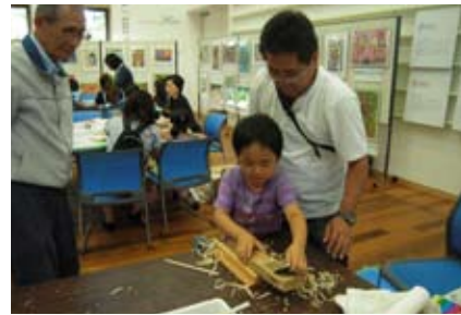
▲自分だけのオリジナルマイ箸を作りました