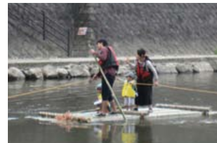
▲親子で竹いかだ体験♪

「環境フェスタかごしま」は、環境団体や事業者、行政が協働して開催するイベントです。様々な展示やステージショーを楽しみながら、いろんなエコを見つけよう！作って遊べる竹いかだ体験やささまざまなワークショップが体験できます！すてきな景品がもらえるクイズラリーも実施。子どもから大人まで楽しめるイベントが盛りだくさん！10月の連休はぜひ未来館へお越しください♪