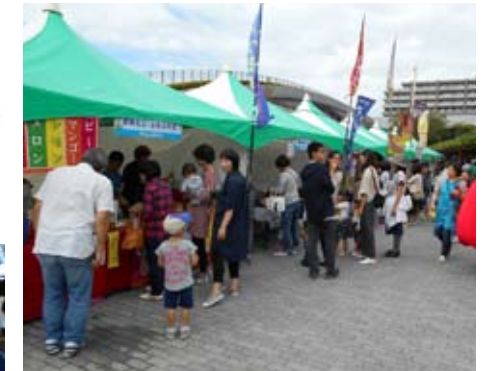
▲飲食ブースも出展します♪