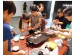
▶ じゃんぼ餅づくりに挑戦しました！

6月の環境月間に合わせて、「リユースはアートなり。」をテーマに企画展を開催しました。期間中は花王国際子ども環境絵画コンテストの入賞作品をご覧になっている方、週末の工作ワークショップなどに参加して下さった方などで大変にぎわいました。今回の企画展をきっかけに、いらなくなったものでも工夫次第でこんなに楽しめるものになると、リユースをより身近なものとして感じていただければ嬉しいです。12月の地球温暖化防止月間にも楽しい企画展を開催する予定です。お楽しみに♪