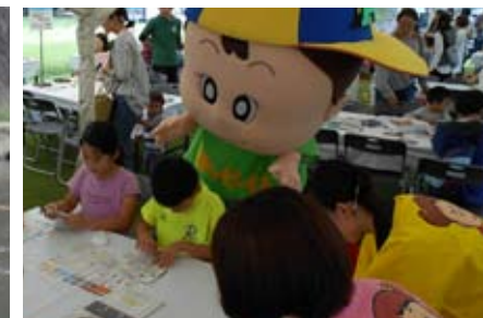
▲いろんなワークショップを体験できます♪