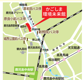
リサイクル適正の表示:紙へのリサイクル可

かごしま環境未来館よりは、かごしま環境未来館、市役所、各支所などで無料配布しています。