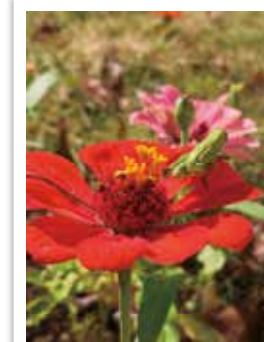
小中高校生部門 特別賞 「ひなたぼっこ」