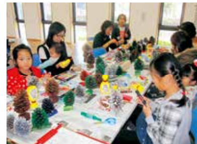
▶松ぼっくりでクリスマスツリー作り