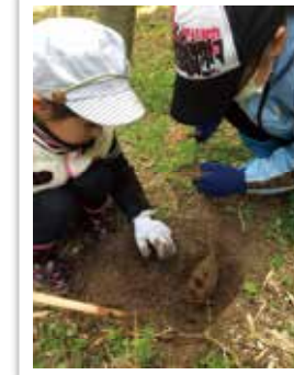
小中高校生部門 特別賞 「見つけたよ」

僕のおじいちゃんよりもっと歳をとって大昔から立っている木だと聞いてすごいと思いい写真をとりました。