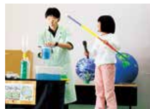
▶らんま先生のパフォーマンスをお手伝い！