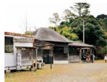
▲自然いっぱい平田の里山

活動の中で一番大事にしていることは、自分の目で見て、匂いを嗅いで、味わって、直接触れて、実感してもらうこと。話を聞くだけでなく、自分のワクワク、ドキドキする感覚を大事にしてほしいとの思いで、日々活動しています。