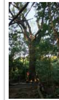
小中高校生部門 特別賞 「城山のおじいちゃん」

わたしがおにわにうえたお花の上でバツタさんがひなたぼっこ。きょうはポカポカあったかいからきもちいい。