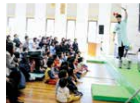
▲らんま先生のパフォーマンスで会場は大盛り上がり！