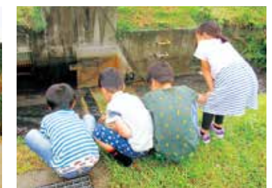
▲目で見て手で触れることが大事