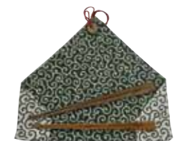
端切れと廃材でマイ箸&箸袋