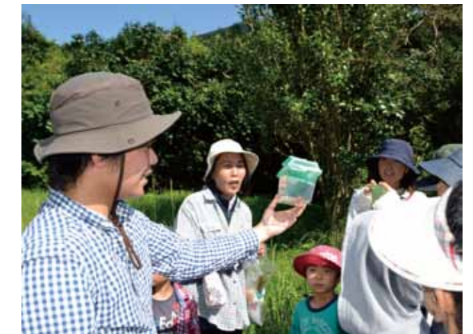
▲生き物観察の様子