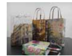
ペーパーバッグ作り

今年も地球温暖化防止月間に合わせて、楽しみながら環境を学ぶ企画展を開催。今回のテーマは「冬エコを楽しもう♪」。期間中は、環境に関するパネル展示やクリスマスにちなんだ工作系ワークショップなどを開催します。ご家族などで環境について話す良い機会になるプログラムばかりですのでぜひお越しください。詳しい情報は環境未来館ホームページに掲載しますのでご覧ください。