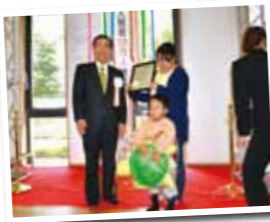
▲100万人セレモニーでパチリ!

今年で14回目の開催となった「環境フェスタかごしま2015」。今年はステージを屋外から館内ゾーン3に移すことで、屋外テントブースの数を増やして実施しました。また、10月に来館者100万人を達成したことを記念して、「100万人セレモニー」も行いました。子どもたちは竹いかだやおもちゃえっこパズールに大はしゃぎ!お父さん・お母さんも、アクリルたわしを作ったり、各団体のエコな取組みについて興味深そうに眺めたりと、楽しんでいただけたようです。ブース展示のほかにもステージイベントや鍋帽子を使ったプリンづくりなど内容盛りだくさんで、多くの家族連れでにぎわいました。ご来場いただいたみなさん、ありがとうございました。