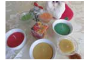
蜜ろうで癒しのキャンドル作り