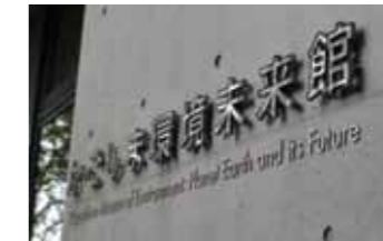
学校のトイレの鏡でサイン