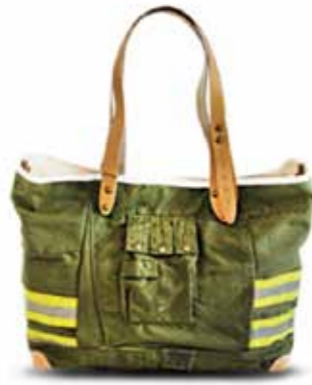
消防服が一点もののバッグに! (MODECO/fireman シリーズ)

今、アップサイクルブランドが続々登場! ちよつと個性的なモノから可愛いグッズまで、ご紹介したモノ以外にも高品質なモノがたくさん商品化されています。見ているだけで、意外なモノや新しい発見ができて楽しいですよ。