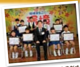
環境メッセージコンテスト表彰式