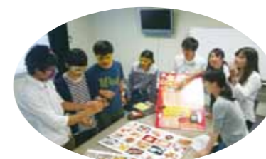
鹿児島大学 Sustainable Campus Project (SCP) さんと市民・企業の方々が協働して取り組む生ごみのアップサイクル活動。