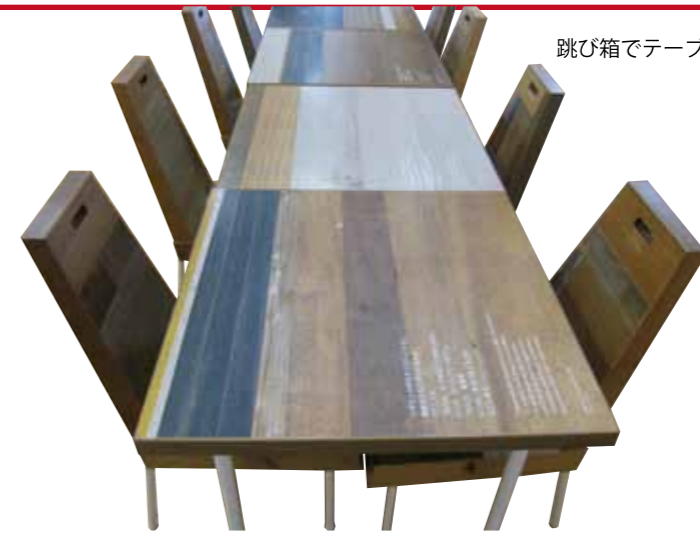
跳び箱でテーブルと椅子