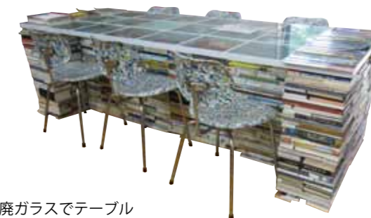
本と廃ガラスでテーブル