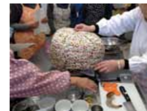
▲鍋帽子を使った料理教室