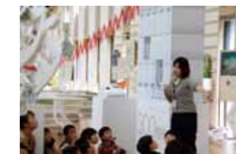
スタッフが館内をご案内

いずれも無料でご利用いただけます。 お申し込み方法など、お気軽にお問い合わせください。(TEL:099-806-6600) http://www.kagoshima-mirai.kan.jp/