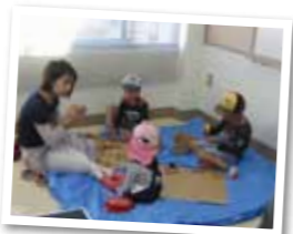
ダンボールハウス作り