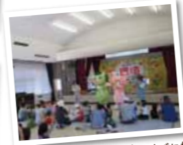
ぐりぶーとさくらと環境クイズに挑戦!