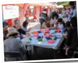
▲カラフルなアクリルたわしを作ろう!