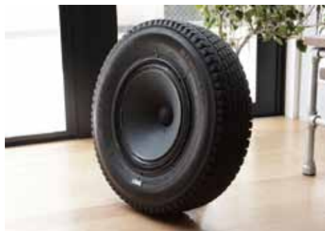
廃タイヤも素敵なインテリアに! (SEAL スピーカー)