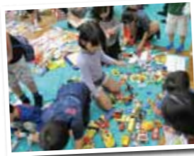
▲いいおもちゃあるかな?