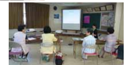
あなたの街までお訪ねします!