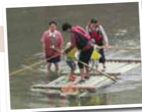
▲どきどき竹いかだ体験!