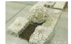
トイレトペーパー芯リサイクル作品