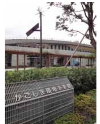
側溝の網状のふたで看板