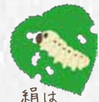
絹は「かいこ」が作っています。

木漏れ日の中で南九州特有の木々や数多くの野鳥や昆虫とふれあいましょう！ 展望台からは桜島を一望できますよ。