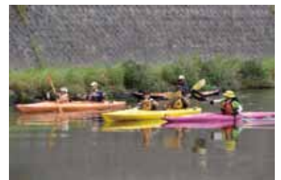
甲突川を乗りこなせ！