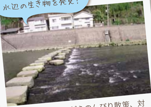
甲突河畔川で、 水辺の生き物を発見！

遊歩道を歩きながらのんびり散策、対岸へは飛び石で渡れます。思いがけない生き物との出会いもあるかもしれません。