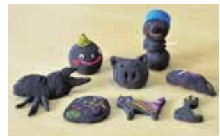
桜島火山灰ねんどで遊ぼう