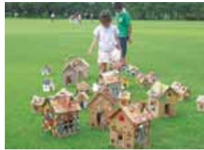
▲オリジナルのダンボールハウス