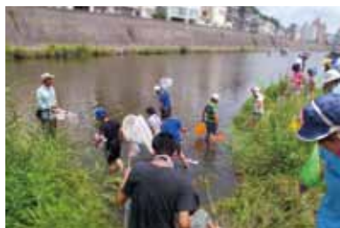
どんな生きものがいるかな？