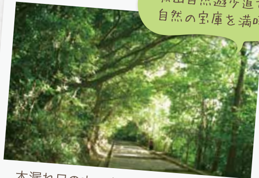
城山自然遊歩道で、 自然の宝庫を満喫。

木漏れ日の中で南九州特有の木々や数多くの野鳥や昆虫とふれあいましょう！ 展望台からは桜島を一望できますよ。