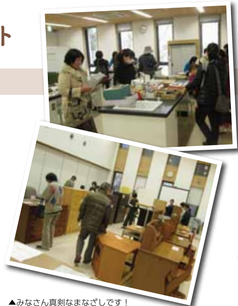
▲みなさん真剣なまなざしです！