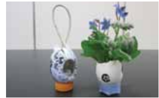
ポプリエッグを作ろう