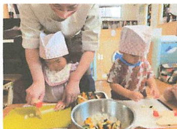
包丁で切るのが難しい👉