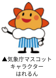
▲気象庁マスコットキャラクターはれるん

普段聞けない天気や地球温暖化について、気になっていることを専門家に気軽に聞けるチャンス！気象や災害、気候変動…難しい話もゆったりとした気持ちで、一緒に考えましょう！専門家ならではのヒミツや、楽しい話が聞けるかも！