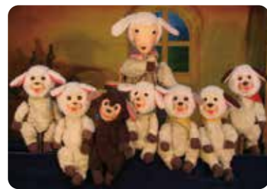
▲人形芝居「おおかみと七匹の子やぎ」