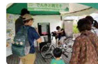
▲自分で電気をつくってみる 体験コーナーなど盛りだくさん

各ブースを回って出される3択クイズを楽しむクイズラリーは今年も人気で「環境について楽しく学べた」という声をたくさんいただきました。ほかにも、「丁寧に説明してもらってわかった」「エコしようと思う」など、環境について考えるきっかけになったようです。ご来場くださった皆様、ありがとうございました！