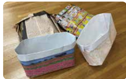
◀いろいろな素材で紙バッグ作り

今回のテーマは『Re!Re?Re:～未来をつくるヒントはRe!～』 期間中は、今年の7月から実施されているレジ袋有料化に関する展示やオリジナルエコバッグの工作体験など、子どもから大人まで楽しめるコーナーが盛りだくさん！その他にも、端材を使った工作体験やこどもエコスケッチ大会の展示など、楽しみながらエコについて考えることができます！詳しくは環境未来館HPまで。