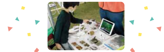
▲実物の展示やワークショップも にぎわいました