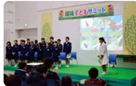
◀子どもたちの声に耳を傾けてみませんか？

これからの世代を担う子どもたちが、環境学習を通して学んだ成果を発表する“環境子どもフォーラム”。昨年まで開催してきた環境子どもサミットから名称を変更し、今年は5つの子どもたちの団体が発表します。発表の後は、WWFジャパンの方を講師として、「地球環境はいま」というテーマで講演を行う予定です。また、環境フォトコンテストの表彰式も同時に開催します。子どもたちの声に耳を傾けてみませんか？