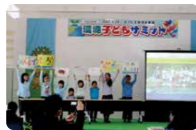
▶環境に関するメッセージを伝えます