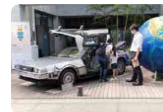
▲あのデロリアンがやってきました！