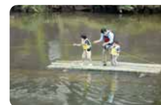
▲鹿児島の竹でつくったいかだに乗って、 甲突川に親しもう