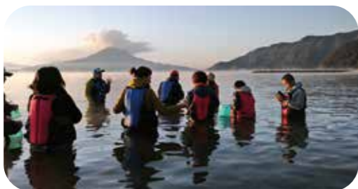
▲ウエーダーウォーク(海中散歩)

くすの木自然館は、人と自然の持続可能な付き合い方を提言し、鹿児島県の豊かな自然を後世に、よりよい形で引き継ぐことを目的とした団体です。環境調査や研究をはじめ、自然体験プログラムや共生・協働の地域社会づくりに関する活動支援など、幅広く活動しています。身近な海や川、野山のいきものを観察する様々なツアーを通じて、自然をじっくり満喫できます。自然のおもしろさや美しさを私たちと一緒に楽しみませんか？