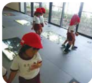
▲環境未来館に行って、いろいろなことを学びました！