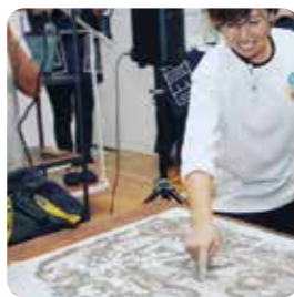
▲火山灰がアートに大変身