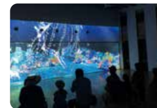
▲神秘的な深海の プロジェクションマッピング