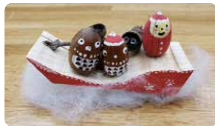
▶端材でつくる工作体験