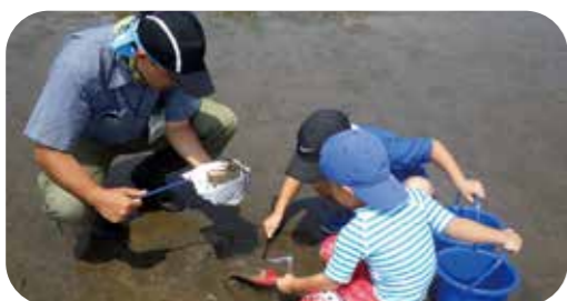
▲干潟のいきものツアー