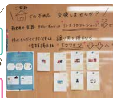
▲エコフリマ掲示板です♪