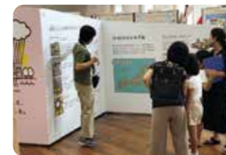
▲リニューアルした展示の解説ツアー

2020年3月にリニューアルした環境未来館。これからもさまざまな環境トピックを楽しく学べる展示案内や講座やイベントを開催しますので、ぜひ足を運んでください！