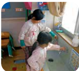
▲使わない時は、水道の蛇口をしめよう！

自分たちにできる小さなことから考えて取り組むことを大切にして、今後もエコについて学んでいきたいと思います。