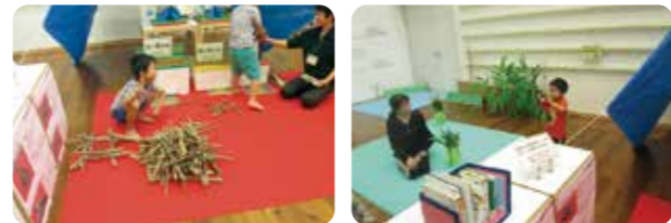
(写真は昨年の様子です)

6月5日は「環境の日」です。これは昭和47年6月5日からスウェーデンの首都ストックホルムで開催された「国連人間環境会議」を記念して定められたものです。国連では、日本の提案を受けて6月5日を「世界環境デー」と定めており、日本では環境基本法で「環境の日」を定めています。また、平成3年度から、6月の1か月間を「環境月間」としています。