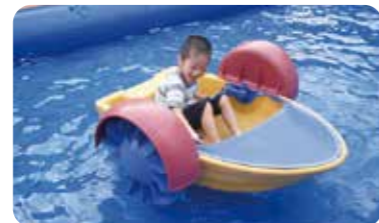
▲パワーパドラーに乗って甲突川を進もう!

親子で参加できる「カヌー体験」やウォーターアトラクションの中でも人気の高い「パワーパドラー体験」、自由研究におすすめ「甲突川生き物観察会」など甲突川での体験が盛りだくさん! また、海の生き物でつくるオブジェ作りなどの工作体験や親子で体験できる夏の料理講座も開催。内容盛りだくさんで2日間イベントを開催します。ぜひご参加ください!! ※一部事前申込が必要なプログラムがございます。