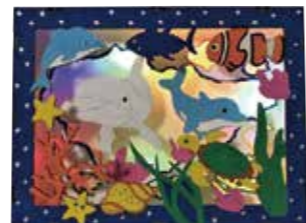
▲海の生き物でつくるオブジェ作り