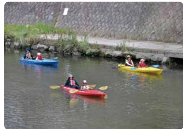
▲甲突川をカヌーで乗りこなせ!

親子で参加できる「カヌー体験」やウォーターアトラクションの中でも人気の高い「パワーパドラー体験」、自由研究におすすめ「甲突川生き物観察会」など甲突川での体験が盛りだくさん! また、海の生き物でつくるオブジェ作りなどの工作体験や親子で体験できる夏の料理講座も開催。内容盛りだくさんで2日間イベントを開催します。ぜひご参加ください!! ※一部事前申込が必要なプログラムがございます。