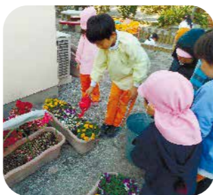
▲お芋の収穫！みんな一生懸命

街中の小さな園庭でも工夫次第で子どもたちが自然を楽しむ環境は作ってあげられます。エコ活動を通して心豊かに育つ「やはたっこ」の今後が楽しみです！