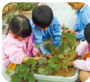
▲水まきは、順番待ちの人気です