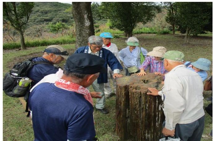
▲パワーを感じる！数万年前？の樹木の化石

初秋の清々しい天候に恵まれ、講座ではこの土地のなりたち、花や植物、樹木の解説を聞きながら自然観察を楽しみ、エドヒガン、ヤマザクラ、ヨウコウ、カワズザクラの4種の桜の苗木とハート型の葉っぱが可愛いカツラの苗木を合計20本植樹しました。樹木医さんの指導の元、穴を深く掘りすぎたり、土をかけすぎる事に注意し、水と愛情をたっぷりかけて植樹完成！来年の春には数輪の桜の開花が見れるそうです。自分の手で植樹した木のお花見に訪れてみるのも楽しみです。植樹後には、桂花園を散策！珍しい植物を見つけたりたっぷりな森林浴パワーで癒やされました。