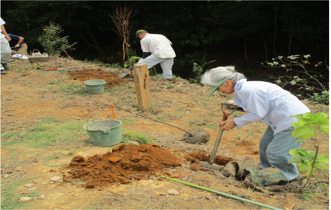
▲穴を掘って堆肥を入れ水をたっぷりかけて愛情を込めて植樹しました。