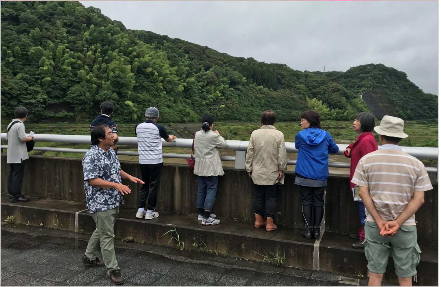
▲西之谷ダムからシラス崖を見学。