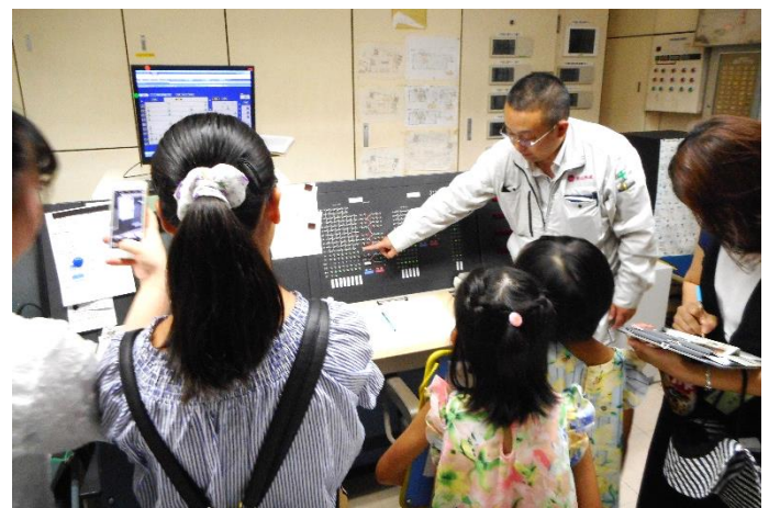
▲エネルギー管理室拝見

今回の共育講座の舞台は何とデパート！まずは、スライドで地球温暖化や簡易包装などの山形屋のエコなところをたくさん聞いた後いざ、山形屋のエコ拝見へ出発！屋上緑化見学では、タイル上と芝生上の温度を計測。この日は時折、雲が太陽を遮り、風もありましたが、それでも温度差が13度もありました。その他、水筒や環境にやさしい文具、洋服をリフォームできる工房などエコな商品・取り組みを拝見！そして、廃棄物置き場では分別の様子を拝見しましたが、デパートでたくさん出るのが衣料用ハンガーで、洗って繰り返し使うハンガーもあるそうです。最後に冷蔵庫蓋のパッキンの中に入っていたマグネットというマニアックな不用品や建築端材、貝殻、余り布などを利用してかわいいマグネット飾りを作りました。エコ商品やいつもの買い物のときには気付かない取り組みを拝見し、デパートに対する見方が変わる貴重な体験となりました♪