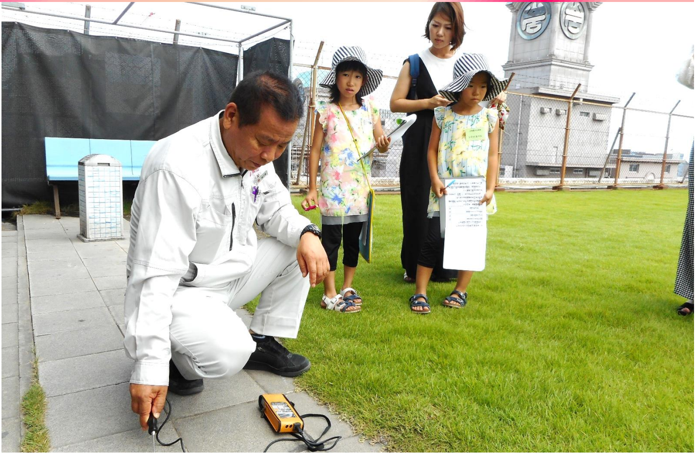
▲屋上のタイル上と芝生上の温度を比較