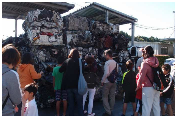
▲スクラップの鉄くずに圧倒！