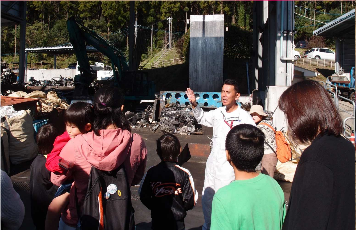
▲廃車から鉄・銅・アルミを分別する作業を見学