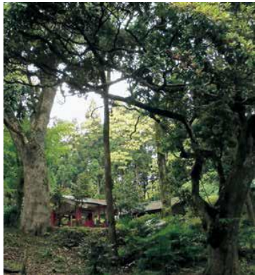
喜入南方神社周辺の森林