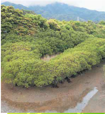
愛宕川河口の干潟