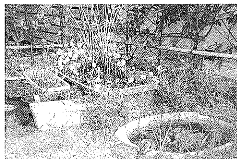
▲ ビオトープ(生物生態空間)