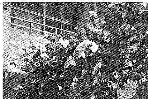
▲ 緑のカーテン(ヘチマ)